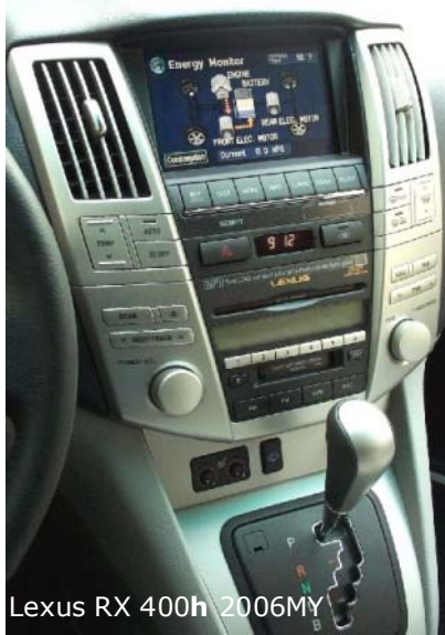
Lexus RX 400h 2006MY

Дальновидное акцентирование внимание на гибридных технологиях, инвестиция достаточных средств в их разработку с лихвой окупаются почти ажиотажным спросом на такие автомобили. Экономичность в городском режиме 4л на 100км – аргумент убийственной силы!